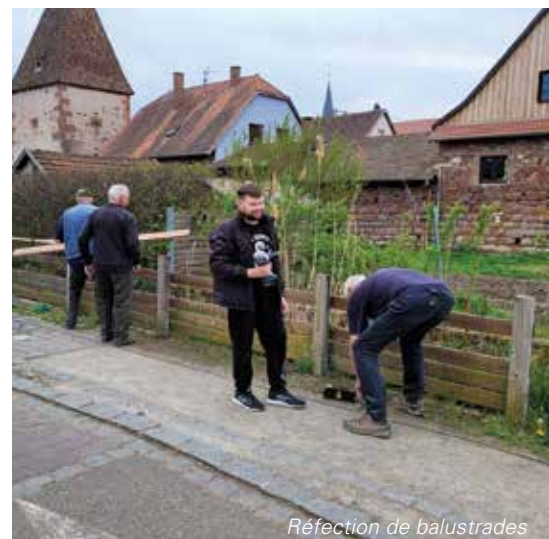
Réfection de balustrades