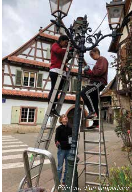
Peinture d'un lampadaire