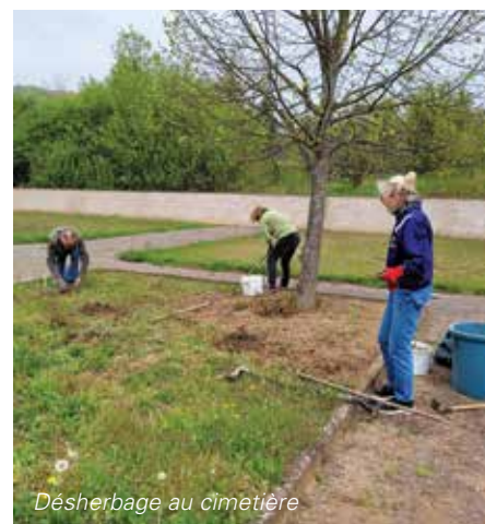
Désherbage au cimetière

Une équipe « intendance » s'est chargée de préparer un délicieux repas offert par la Ville avec le soutien de plusieurs entreprises locales afin de remercier toutes ces bonnes volontés.