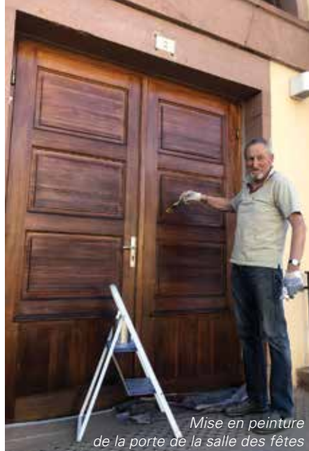
Mise en peinture de la porte de la salle des fêtes