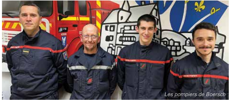
Les pompiers de Boersch

Du 22 au 28 juin, quatre de nos sapeurs-pompiers interviennent dans le cadre d'un renfort extra-départemental dans la Nièvre (58), en Bourgogne. Voilà leur récit.