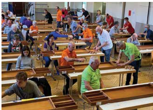
Le Sjoelbak Club de Boersch organisait en mars son tout premier tournoi de sjoelbak ou « billard hollandais », qui a permis à 44 joueurs de différents clubs de se mesurer à ce jeu d'adresse.