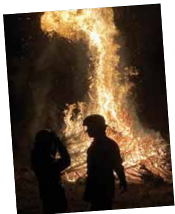
Feu de joie des pompiers : quel beau spectacle offert par nos soldats du feu en ce début janvier grâce aux habitants, nombreux à avoir rapporté leur sapin de Noël. Les mains glacées se sont vite réchauffées avec la soupe de pois, les crêpes et le vin chaud.