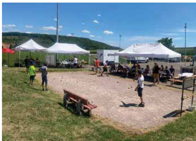
L'Association Sportive des Boulistes de Boersch , outre ses plus de 80 séances annuelles, a organisé deux tournois de pétanque : l'un le 7 mai, réservé aux membres, le second le 9 juillet ouvert à tous qui a rassemblé une cinquantaine de participants.