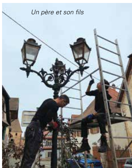
Un père et son fils