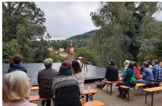
Festival des arts vivants : dans le magnifique cadre du Domaine de la Chouette à Klingenthal le 29 août.