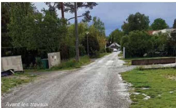
Avant les travaux