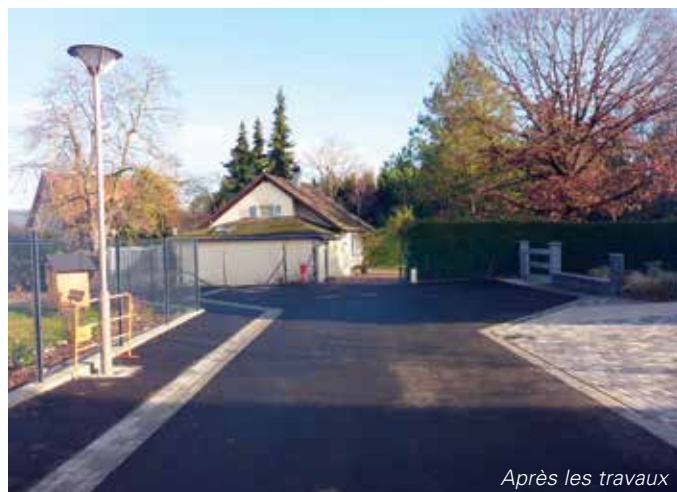
Après les travaux