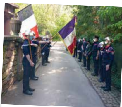
Cérémonie du 8 mai en comité restreint à Boersch (à gauche) et à Klingenthal (à droite).