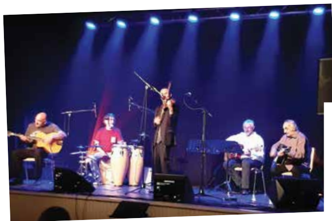
Concert de jazz : beau succès pour les concerts qui ont eu lieu à la salle des fêtes en raison d'une météo capricieuse le 10 septembre.