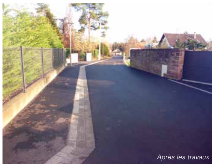
Après les travaux

Nous remercions les riverains qui ont fait preuve de patience et les différents intervenants ayant permis le bon déroulement de ce chantier.