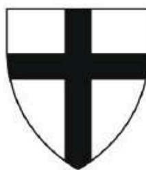
Armoiries de l'ordre Teutonique.