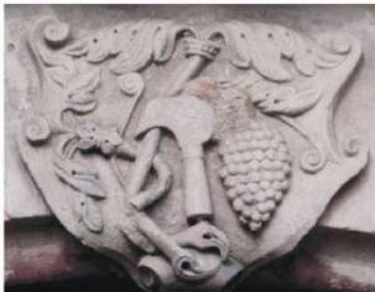
Viticulteur – vigneron (B)