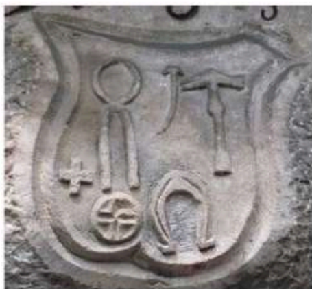
Maréchal- ferrant & serrurier (P)