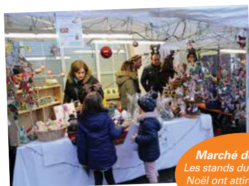
Marché de Noël : Les stands du marché de Noël ont attiré jeunes et moins jeunes.