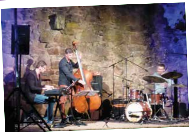
Concert de jazz proposé par la MJC en septembre dernier.