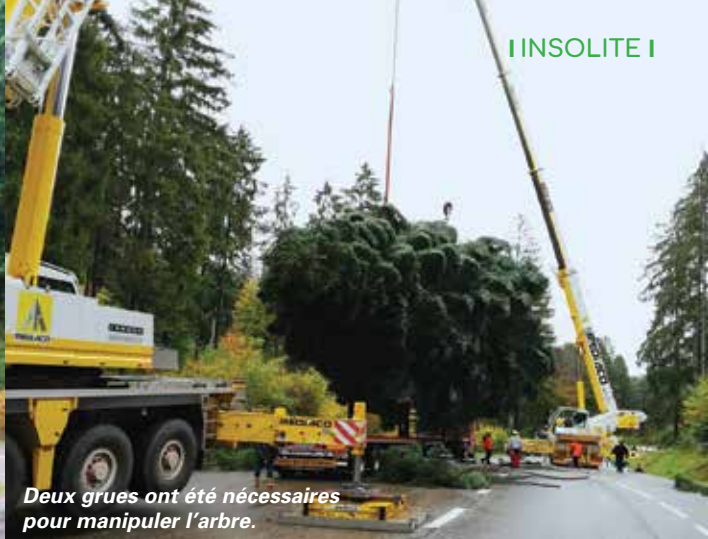
Deux grues ont été nécessaires pour manipuler l'arbre.