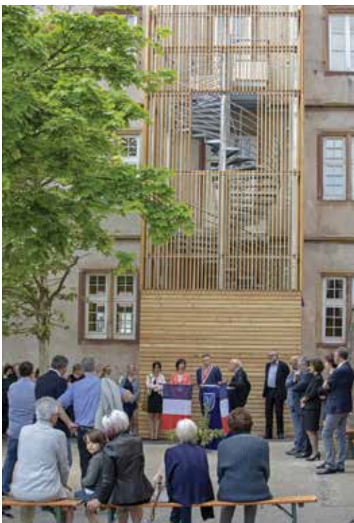
L'escalier de secours a été habillé de bois.