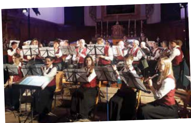
Concert de Noël de l'Orchestre Saint-Médard avec en deuxième partie l'Orchestre d'Ohlsbach.

Amicale des donneurs de sang : L'Amicale avec ses 10 bénévoles a été très active : des actions de promotion du don comme le « Défi vers les jeunes » le 7 octobre et la présence sur le marché de Noël avec un stand très visible, où sa soupe de pois a connu un franc succès. Un grand merci à l'ensemble des donneurs. En ce début 2020, une médaille a été remise par l'EFS à un Boerschois pour ses 130 dons ! Retenez la date de la prochaine collecte mardi 11 février prochain.