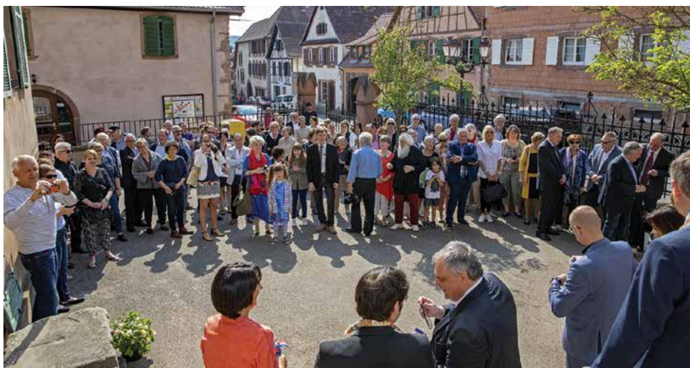
Une inauguration sous un magnifique soleil.

L'installation des sanitaires à l'intérieur du bâtiment de l'école va permettre de démolir le bâtiment extérieur disgracieux situé dans la cour afin d'agrandir cet espace. Des exercices de sécurité et d'incendie ont été réalisés afin que les élèves puissent acquérir les réflexes pour une évacuation rapide.