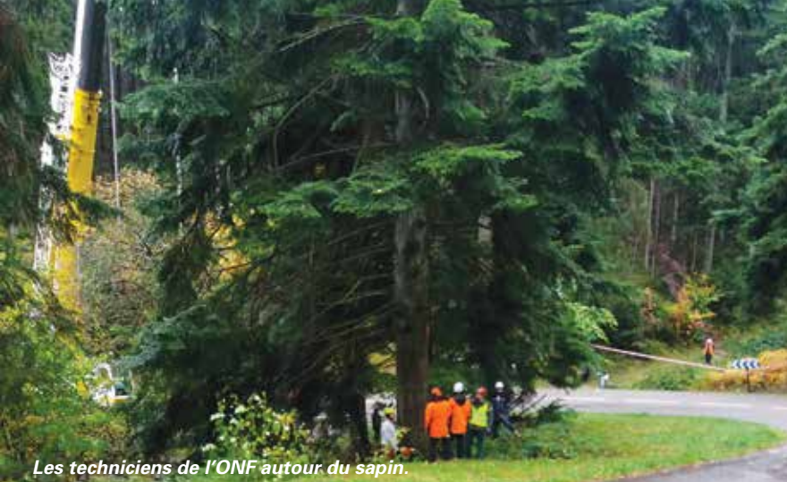
Les techniciens de l'ONF autour du sapin.