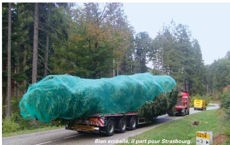
Bien emballé, il part pour Strasbourg.