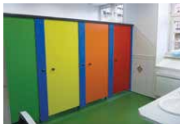
Les sanitaires sont désormais à l'intérieur du bâtiment.

Un cadre de vie spacieux et coloré pour nos écoliers.