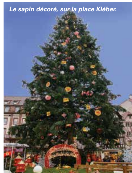
Le sapin décoré, sur la place Kléber.