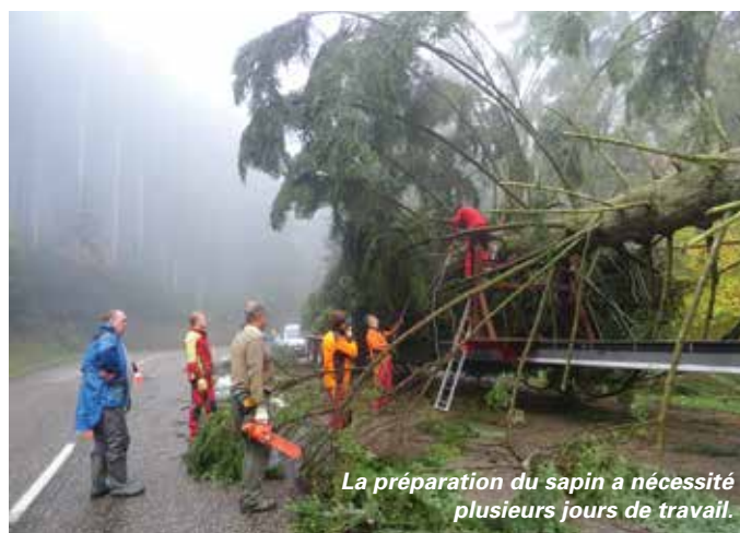
La préparation du sapin a nécessité plusieurs jours de travail.

Après plusieurs jours de préparatifs, le sapin était enfin prêt à prendre la route. Une fois installé sur la place Kléber, il a été garni de branches supplémentaires venant d'autres sapins afin de le rendre encore plus beau. Ne restait alors plus qu'à le décorer de boules et de guirlandes qui l'ont fait scintiller de mille feux pour le plus grand plaisir des visiteurs venus du monde entier.