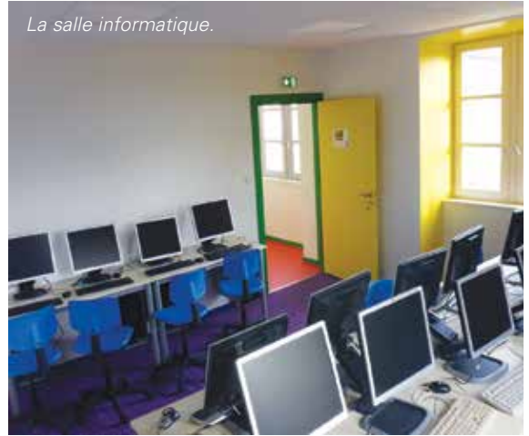
La salle informatique.

L'Hôtel de Ville est à présent pleinement adapté aux besoins actuels et offre un cadre de travail agréable aux agents communaux. La population est également accueillie dans les meilleures conditions.