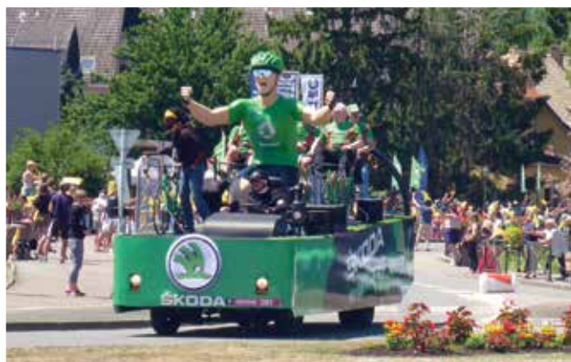
La caravane du Tour constitue un spectacle à elle seule !