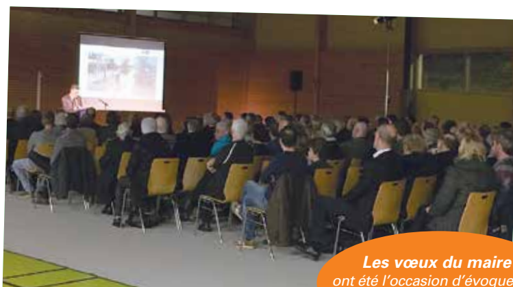
Les vœux du maire ont été l'occasion d'évoquer les réalisations de l'année 2019.