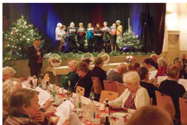
Fête de Noël de nos aînés