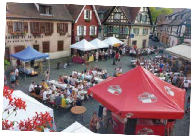
Marché d'été des commerçants