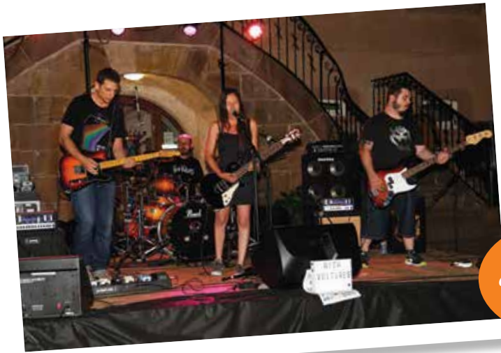
Fête de la musique