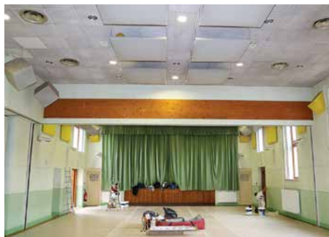
Plusieurs entreprises se sont succédé pour réaliser les travaux durant trois semaines.