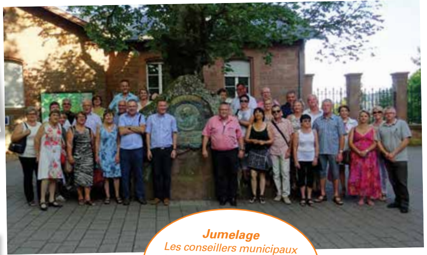
Jumelage Les conseillers municipaux des deux communes se sont retrouvés au Mont Sainte Odile le 23 juin dernier