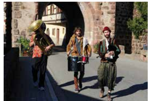
Des musiciens en costumes d'époque ont parcouru les rue de la ville à l'occasion d'un banquet médiéval organisé par le moto-club.