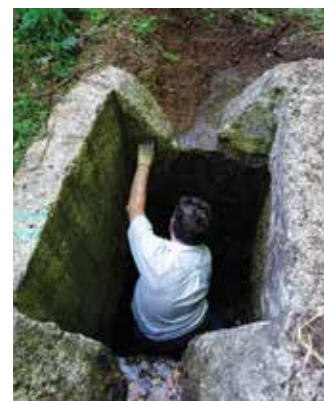
Les bénévoles s'affairent sur les ouvrages.

matériel, sacs de béton, mortier, bidons d'eau, planches et l'outillage pour réaliser les coffrages. L'objectif a été atteint : tous les puits ont été réparés.