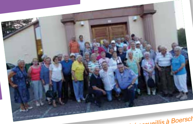
Jumelage : Les seniors d'Ohlsbach ont été accueillis à Boersch fin mai, une visite du nord de l'Alsace leur a été proposée. La journée s'est terminée à la salle des fêtes autour d'une bonne tarte flambée.