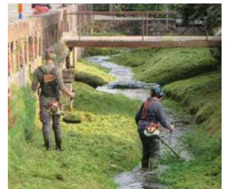
Les activités des agents de nos services techniques sont aussi diverses que variées.