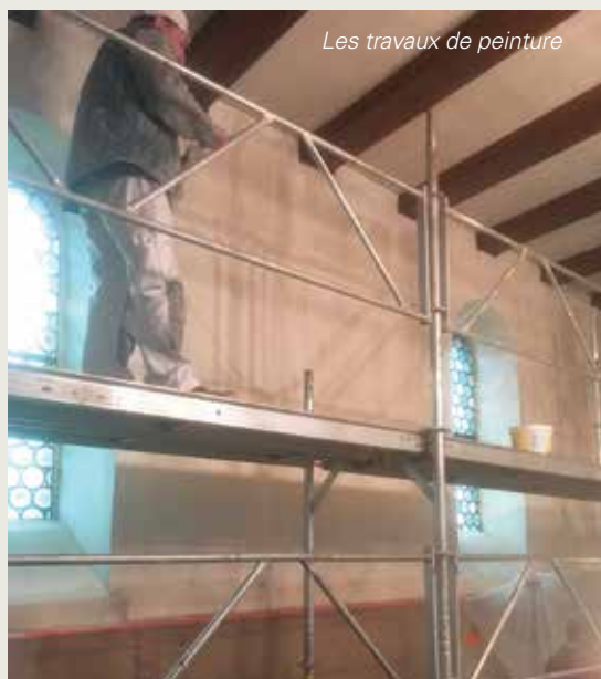
Les travaux de peinture

Le Conseil de fabrique de l'église Saint Médard de Boersch a décidé de procéder à des travaux de peinture intérieure de la chapelle du cimetière. L'entreprise Denis Sohler de Nothalten a été retenue pour réaliser ces travaux pour un montant de 7027 euros TTC. Les travaux sont à présent achevés.