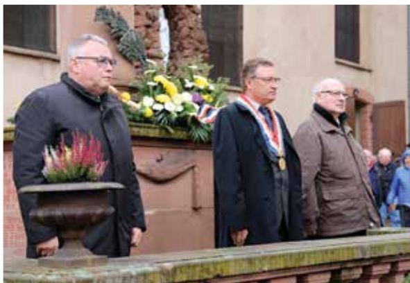
Cérémonie du 11 novembre

Pour la cinquième année consécutive, dans le centre historique de notre ville, l'association « Les pros des 3 portes », réunissant 22 artisans, commerçants et indépendants de Boersch, Klingenthal et Saint Léonard, a invité la population à partager un moment convivial et chaleureux lors de son marché de Noël. Une façon originale de se faire connaître, de promouvoir les entreprises et les commerces de nos communes, de présenter leur savoir-faire et leurs compétences. Tout au long du week-end, la population a pu apprécier les créations artisanales, les produits du terroir et ceux de Châtel, dans le cadre de notre jumelage. De nombreuses animations ont été proposées : concerts, contes gratuits, promenades en poney, présence du Père Noël et ce jusqu'à la tombée de la nuit, sous les illuminations de la place de l'Hôtel de ville.