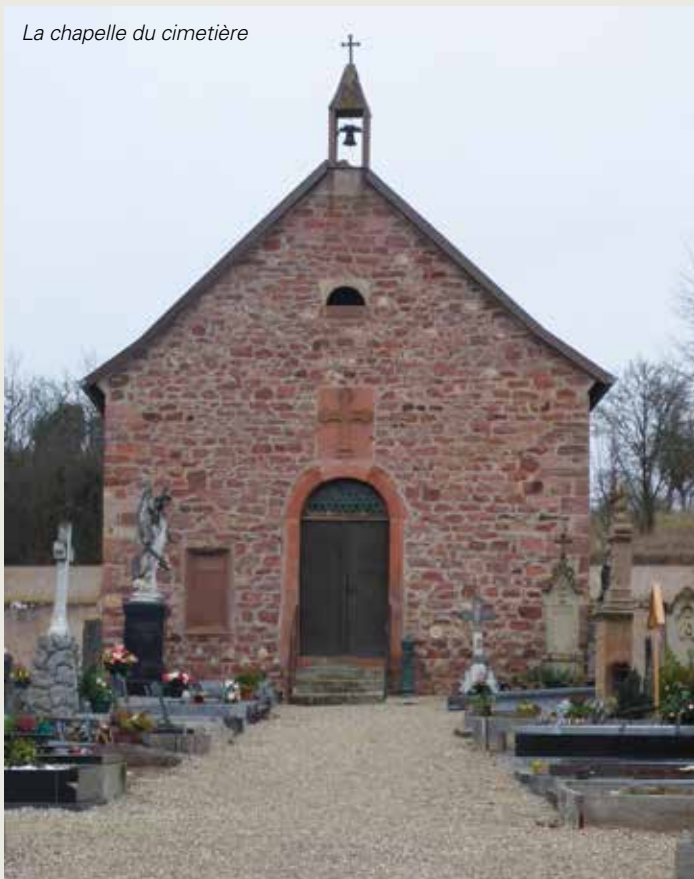
La chapelle du cimetière

La maison communale va retrouver une nouvelle jeunesse tout en conservant son rôle de lieu de rencontres, d'échanges et de convivialité.