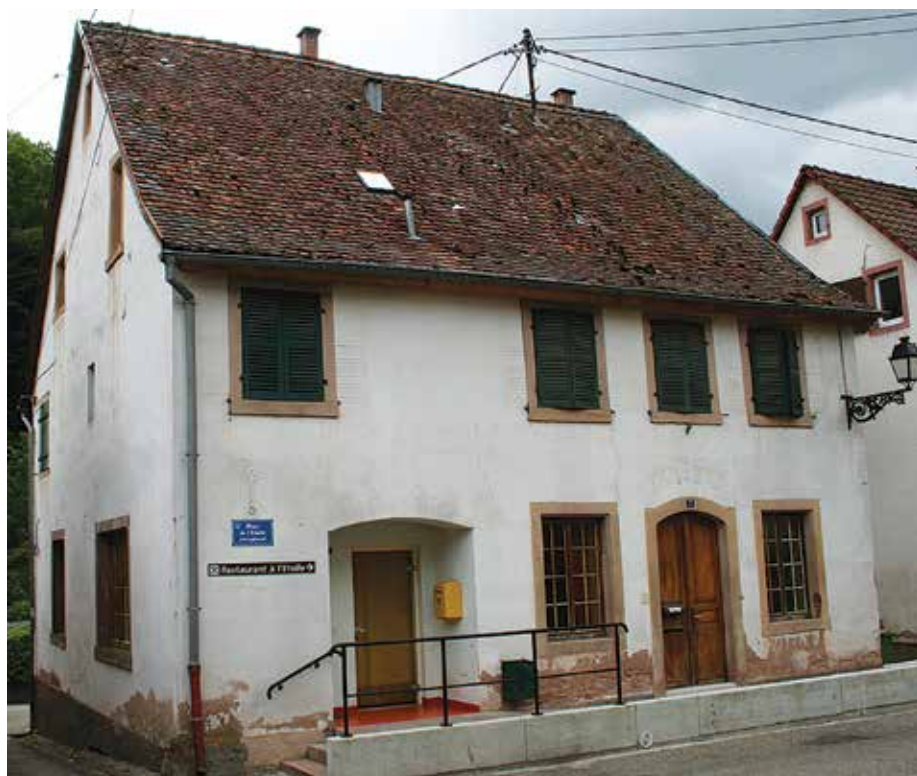
Le côté nord de la maison communale (photo du haut), place de l'Étoile avec l'entrée principale et sa rampe d'accès handicapé. Côté sud (photo du bas), rue Paul-Appell, avec le perron et la double porte cintrée.

Elle est entretenue par l'association AVK (l'Âme de la Vallée du Klingenthal). Le bâtiment est pourvu d'un premier