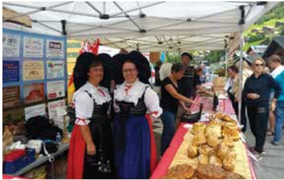
Jumelage : Une délégation de nos professionnels s'est rendue à la Belle Dimanche à Châtel, au mois d'août 2017.