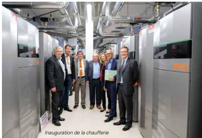
Inauguration de la chaufferie

! EST-MÉNAGER, entreprise familiale implantée à Boersch depuis 1966, est pionnière dans le domaine du chauffage par biomasse depuis plus de 15 ans. En 2017, elle a contribué à l'installation d'une nouvelle chaufferie à granulés de bois pour le quartier de la Meinau à Strasbourg. Pour cette imposante installation, pas moins de 22 chaudières en cascade de 5,5 mégawatts desservent 1 400 logements. La chaufferie est alimentée à 100 % par la biomasse naturelle locale car le bois utilisé pour les granulés provient des Vosges. Ses émissions de CO2 sont quasi nulles. Cette installation a un caractère unique et innovant au niveau national. Elle a été inaugurée le 27 septembre dernier.