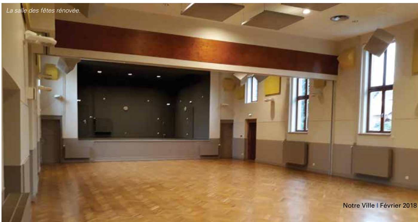
La salle des fêtes rénovée.

En 2017, la municipalité a décidé de procéder à de nouveaux travaux de rénovation qui s'avéraient nécessaires. Ils concernent la peinture intérieure, l'éclairage, les dalles du plafond et le parquet. Les travaux ont été effectués en trois semaines, entre le 12 novembre et le 7 décembre. Leur coût s'élève à 38 280 euros. Nos aînés ont été les premiers à pouvoir apprécier la salle des fêtes rénovée au cours de leur traditionnelle fête annuelle.