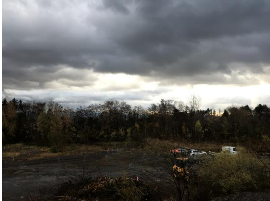
Préparation en contrebas des carrières

Les travaux de préparation ont également débuté en contrebas des carrières avec le criblage du porphyre. Les premières plantations ont, par ailleurs, été réalisées à la gare d'Ottrott.