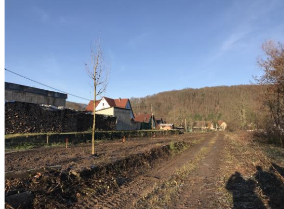
Plantations, gare d'Ottrott

Les études du mobilier sur mesure ainsi que des structures (belvédère, portes de la Léonardsau et les différentes passerelles) sont en cours de finalisation . La validation va se poursuivre prochainement par la phase de réalisation des prototypes.