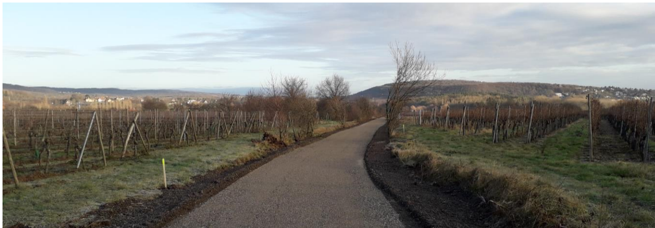
Etat actuel de la voie, à Ottrott (au 1 er janvier 2019)

Les travaux ont débuté fin novembre 2018 par l'élagage du linéaire de l'ancienne voie ferrée de manière à libérer l'emprise pour les véhicules de chantier.