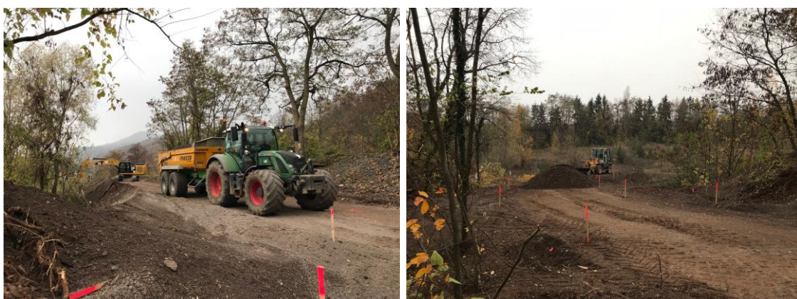
Nivellement de la voie

A commencé ensuite une phase de préparation du fond de forme depuis le bas des carrières vers la gare d'Ottrott : décapage du porphyre existant, chaulage de la structure (traitement à la chaux) afin de garantir une stabilité de la chaussée.